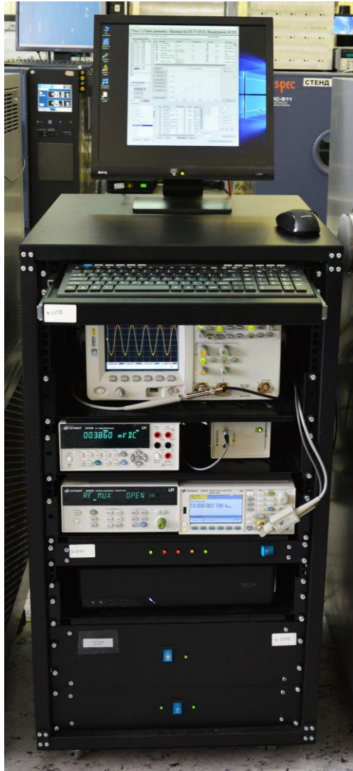
Установка контроля ТЧХ кварцевых генераторов

Это оборудование позволяет методом последовательного опроса в автоматическом режиме регистрировать различные электрические параметры каждого измеряемого изделия во времени. Такими параметрами, для примера, являются частота измеряемого сигнала, его амплитуда, постоянные напряжения и токи. При этом количество испытываемых изделий ограничивается только пожеланием Заказчика